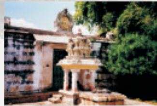
Alter Tempel zwischen Tiruvallur und Pandur