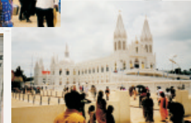
Einige Bilder aus dem "ganz normalen" indischen Alltag...