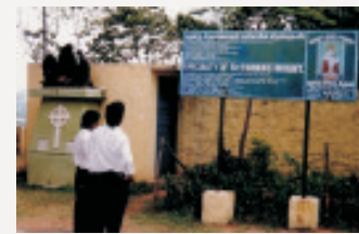
St. Thomas Mount bei Chennai (Madras)