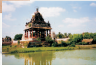
Der große Vishnutempel in Tiruvallur