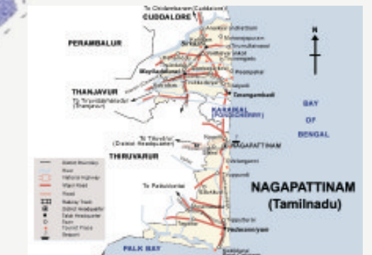
Die Region um Tranquebar